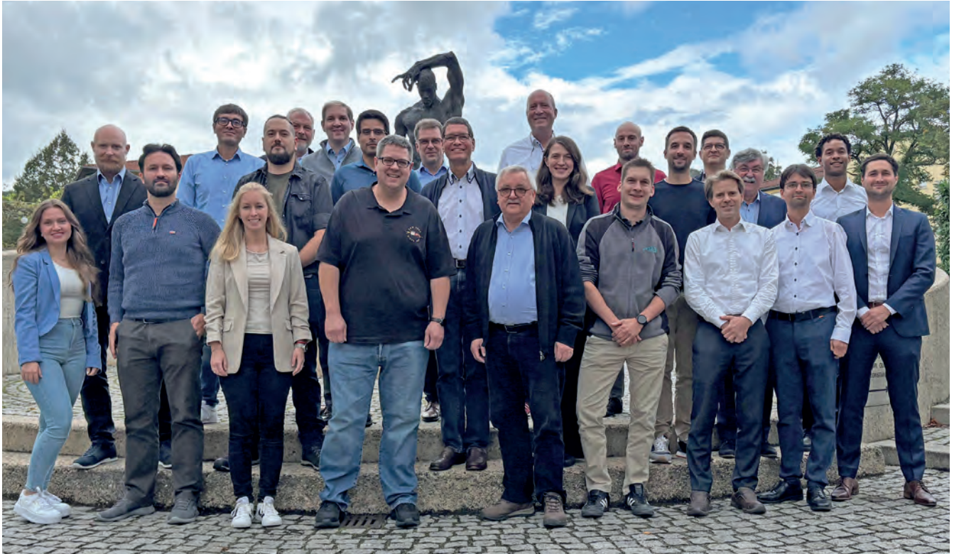
Die Projektbeteiligten auf dem Kickoff von OdyZeus-a