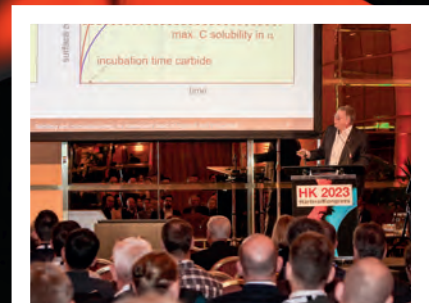
Call for Papers HK 2025