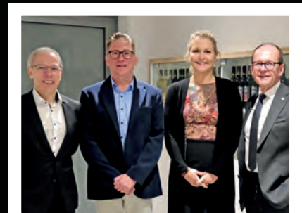
50 Jahre Härtereikreis Stuttgart