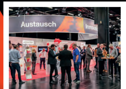
80. Härtereikongress in Köln